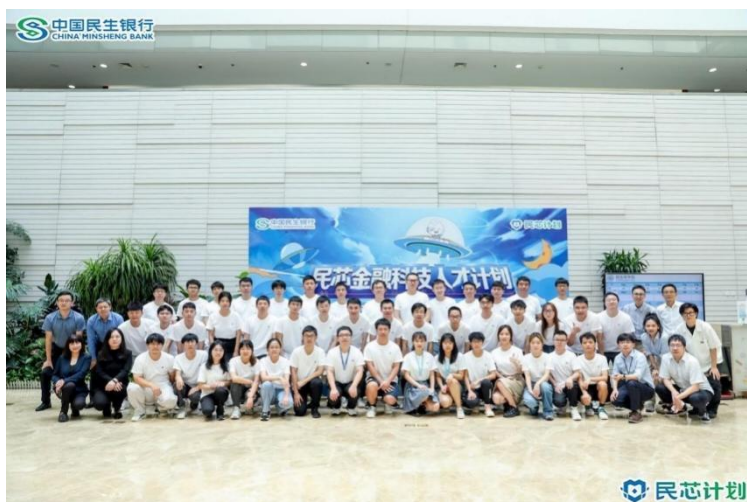
民芯金融科技人才计划

报告期内，本行在人力资源招聘方面获得了多种荣誉奖项，包括智联招聘联合北京大学社会调查研究中心、北京大学国家发展研究院联合颁发的“2023 中国年度最佳雇主 30 强”奖项、前程无忧颁发的“2023 中国典范雇主”和“HR 管理团队典范”奖项、牛客网颁发的“2023 年度 NFuture 科技人才最青睐校招雇主”奖项、猎聘网颁发的“2023 年度非凡雇主”奖项。