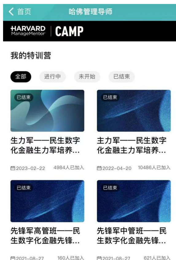
数字化金融人才培养计划

为落实本行数字化金融战略要求，加快全行数字化金融战略专业人才培养与专业能力提升，总行于 2021 年启动为期三年的数字化金融领导力系列培养项目，采用“线上+线下、行内+行外、学习+研讨、思考+实践”的共创共建学习模式，打造了一支推动民生数字化金融战略实施的先遣部队，加速实现数字化转型、实现数字金融规划。三年来，累计培养中高管和绩优青年员工共 9,398 人。