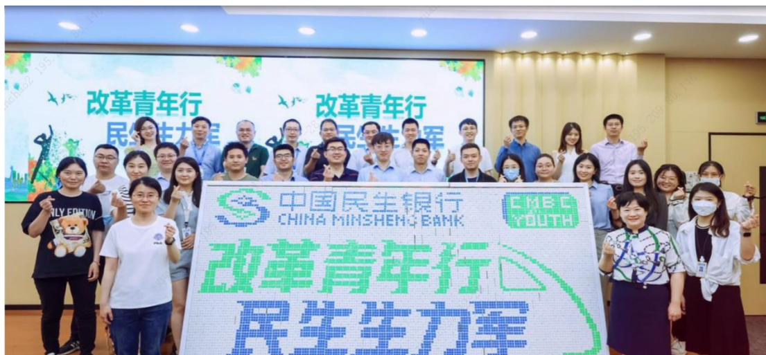
民生青年成长训练营

支持员工考取专业资格认证。 本行高度重视员工的专业发展，为全体员工获取外部核心资格认证提供相关费用支持和保障，全力支持员工考取特许金融分析师（CFA）、国际金融理财师（CFP）、金融理财师（AFP）、国际注册会计师（ACCA）、金融风险管理师（FRM）、项目管理专业人士（PMP）等各类专业资格认证，鼓励员工参加行外机构组织的认证考试相关培训班、讲座，推动实现学考一体化，进一步提升员工参与专业资格认证的积极性。经批准后，本行可为全体员工报销外部核心认证的相关费用。报告期内，本行共有 3,294 名员工获取专业资格认证。